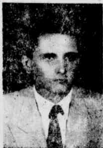
WALCEMIR -- Iluminação para São Torquato