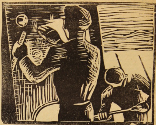
linoleum de d. salinas

¿qué significan los diferentes grupos estudiantiles?