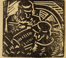
(De la página 6)

En suma: hé aquí un perfecto ejemplo de la crueldad automática del régimen capitalista.